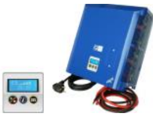
Q6 – Q8 Lader