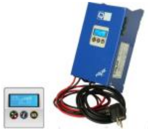
Q1 – Q3 Lader