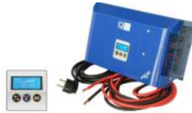
Q5 – Q7 Lader