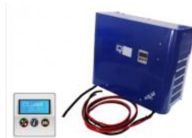
Q9 – Q10 – Q11 Lader